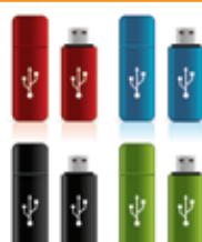
アルミ上の加飾例 Decoration for aluminum