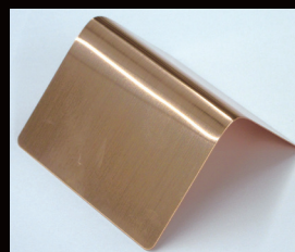
Protector HB-HR1塗膜の折曲げ試験 Bending test