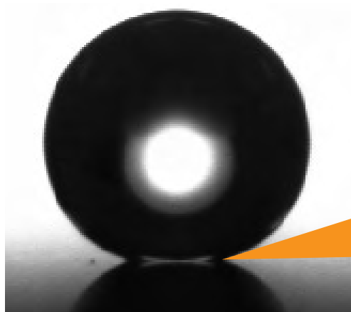
接触角:155.1° Contact angle