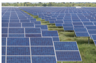
電池 (太陽電池、燃料電池) Solar battery, Fuel cell

Use for forming protective films for electrodes, sintering agents for ceramics and powdered metals, sealing of electronic components